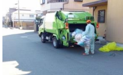
公用車の現在位置